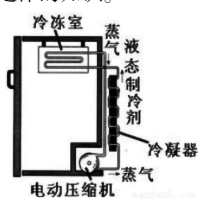
上图是冰箱的工作原理图,气态制冷剂

冰箱是厨房必备的另一重要用具,冰箱可以使箱体内的温度降到很低,从而冷冻食物,那么冰箱又是怎样使冰箱内的温度降到很低的呢?原来冰箱的工作原理主要用到了热力学第一定律的知识。